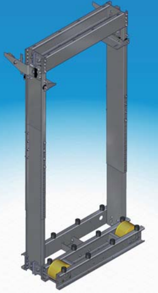
CF sm reitend mit SG, Gleitführung