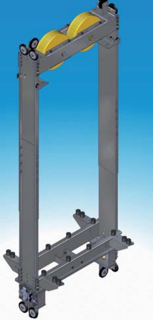
CF sm 2 Rollen oben mit BF, Rollenführung