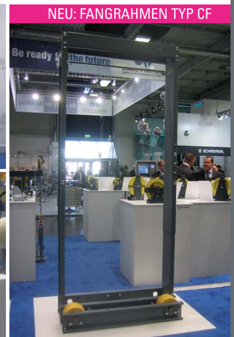
NEU: FANGRAHMEN TYP CF