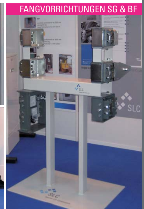
FANGVORRICHTUNGEN SG & BF